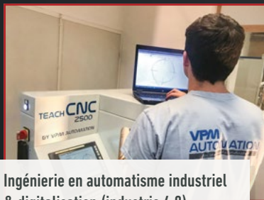
Ingénierie en automatisation industriel & digitalisation (industrie 4.0)