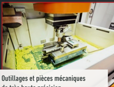
Outillages et pièces mécaniques de très haute précision