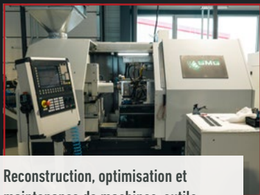
Reconstruction, optimisation et maintenance de machines-outils