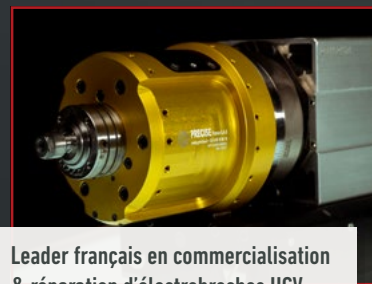
Leader français en commercialisation & réparation d'électrobroches UGV