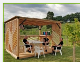
La Qualité de Vie au Travail (QVT) au cœur de nos préoccupations !