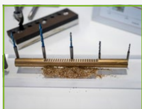
Usinage du laiton sans plomb grâce à des géométries d'outils uniques

Engagé dans une démarche RSE depuis 2019, PRACARTIS a mis au point un plan d'action visant à réduire son empreinte environnementale et à diminuer son bilan carbone . Ces actions visent également à consolider les conditions et la qualité de vie au travail , ainsi que son ancrage local .