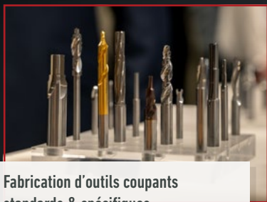
Fabrication d'outils coupants standards & spécifiques