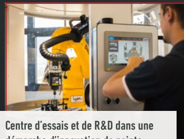
Centre d'essais et de R&D dans une démarche d'innovation de pointe

Vous accompagner dans toutes les phases de vos projets d'usinage de précision : voilà la promesse du Groupe PRACARTIS.