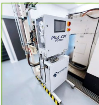
Intégration de l'eco-fluide Supercritique sur tous types de machines outils