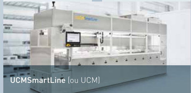
UCMSmartLine (ou UCM)