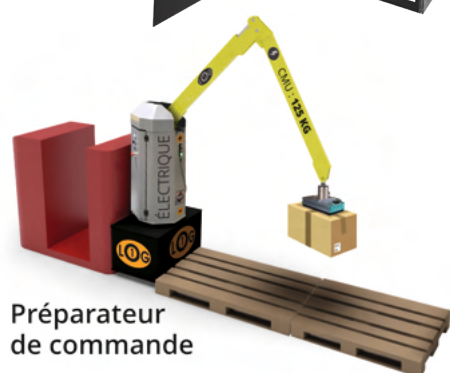
Préparateur de commande