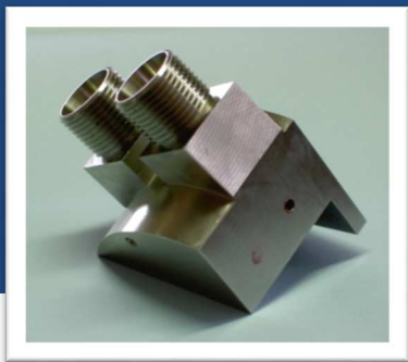
Mécanique de Précision