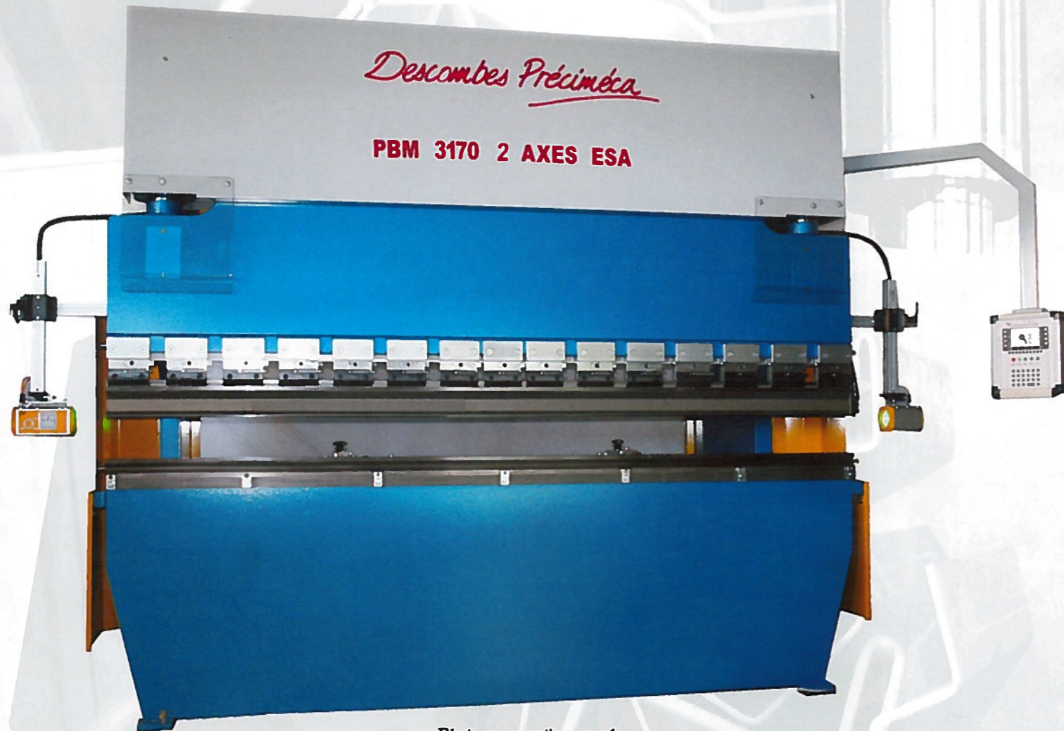
Photo avec option caméra et poste de commande à droite

Descombes Préciméca CONSTRUCTEUR FRANCAIS