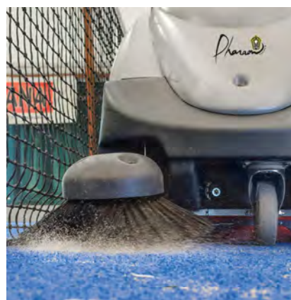
Action de balayage de la brosse latérale qui ramène les impuretés au centre