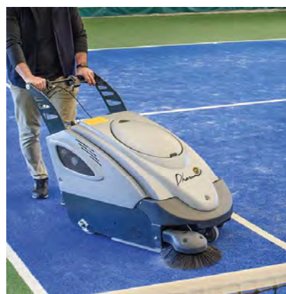
Entretien facile et rapide des terrains de sports