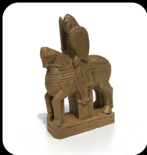
Matière PLA/PHA chargé bronze Impression en 3 heures