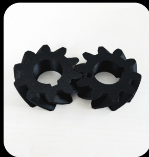
Matière Nylon Carbone PA6-CF Impression en 7 minutes