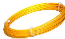
Aiguille de rechange