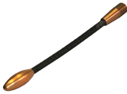
Tête de guidage flexible Ø 7 mm