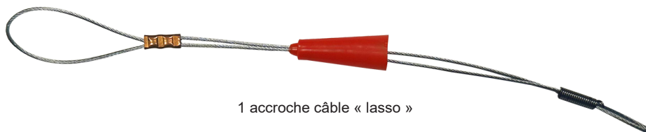
1 accroche câble « lasso »