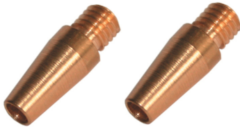
Embouts filetés M5