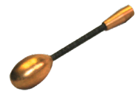
Tête de guidage flexible Ø 13 mm