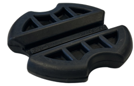
Poignée de tirage GRIP