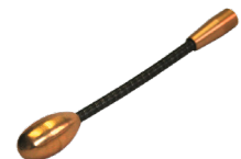
Tête de guidage flexible Ø 10 mm