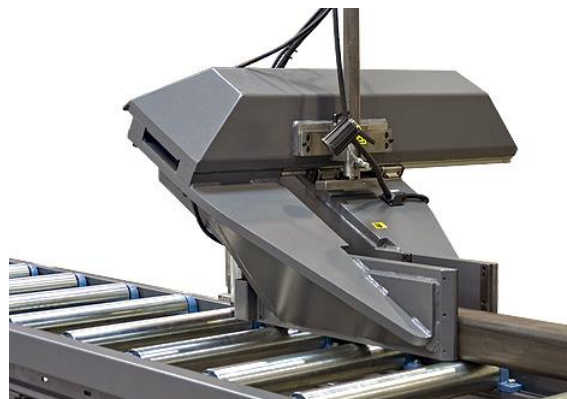
Avance-barre et pince avance-barre