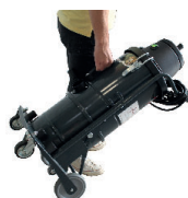
Poignée à la verticale pour un transport facile