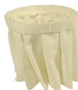
Filtration à poches Grande surface filtrante