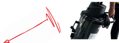
Poignée de poussée