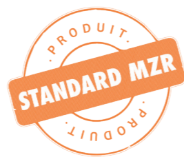
TABLE BASCULANTE DUO POSTES SYNCHRONISÉS

Les Tables Basculantes Duo sont conçues pour le montage et la manutention de produits imposants en longueur et en largeur. Idéales pour les portails coulissants ou les simples vantaux, chaque table est utilisable indépendamment.