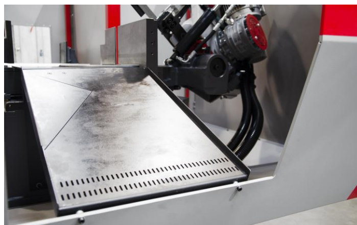
Tablier d'évacuation des pièces coupées