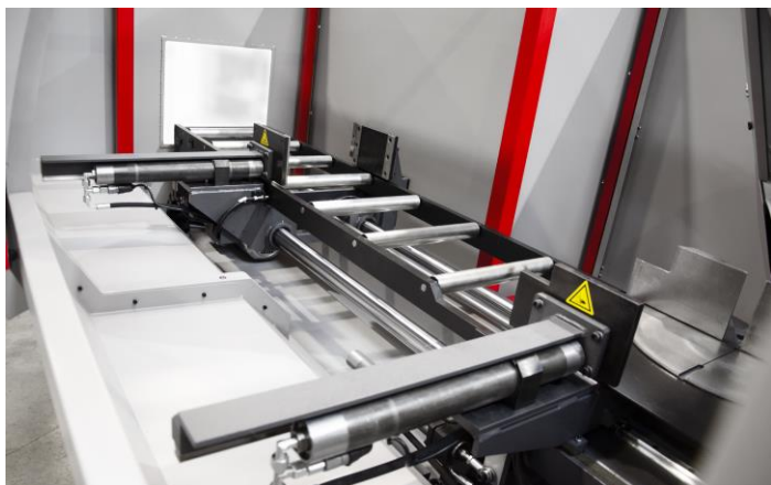
Chemin avec étau avance-barre