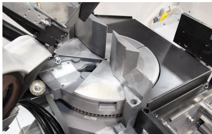
Plateau pivotant à chaîne