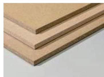
Planche d'aggloméré (19mm épaisseur)