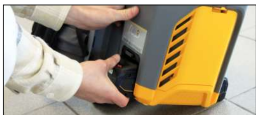
Batteries clipsables et interchangeables facilement