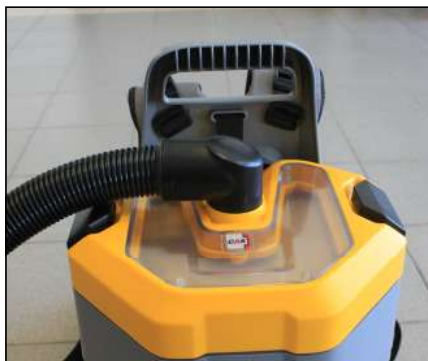
Niveau de remplissage facilement visible