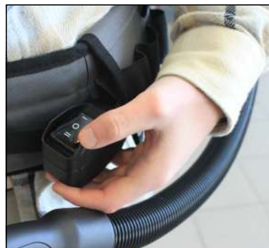
Ajustement de la puissance rapide