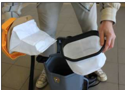
Sac et filtration intégrés