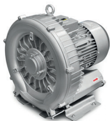
Puissant moteur triphasé