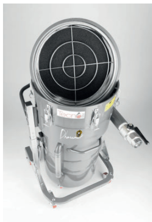
Filtre 3D SUPERWEB avec une grille de tamis permettant la séparation des copeaux et des liquides chargés