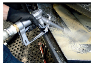
Système de vidange par inversion de flux